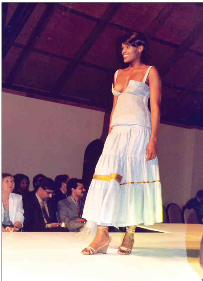
Z módní přehlídky FAO Flax, Port Elizabeth

Definitivní rozpočet reklamní agendy lnu na rok 2006 ještě není sestaven. Podle vyjádření odpovědných pracovníků jednotlivých sekcí, kteří dnes svým podílem reklamu financují, lze pro příští rok počítat se stejnou částkou, jako v letošním roce, tj. cca 1,25 milionů EUR.